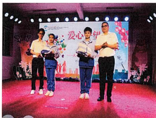
图为学生捐助校服物资